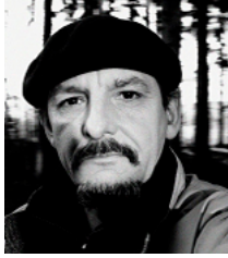
РЕЖИСЕР Мірослав Янек